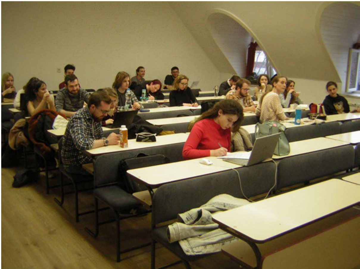
Diszkussziós estek az E541-es teremben.