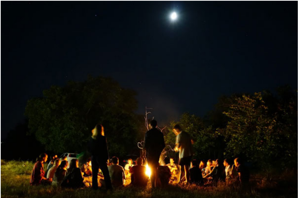
Közösségépítő programok és tábortűz a kővágószőlősi csapatépítő hétvégén.