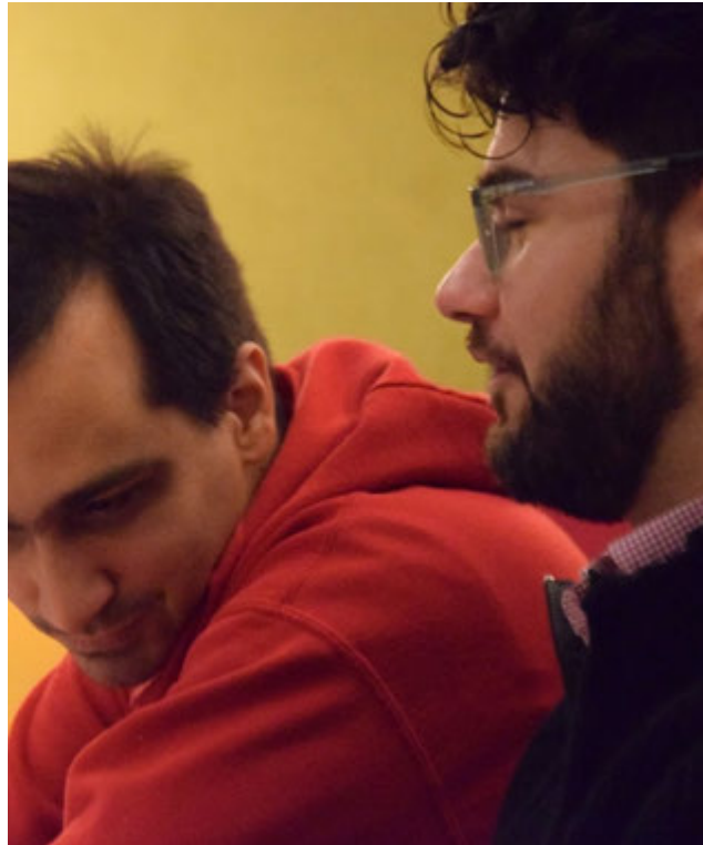
Közösségi program a Kerényi Karácsonyon.