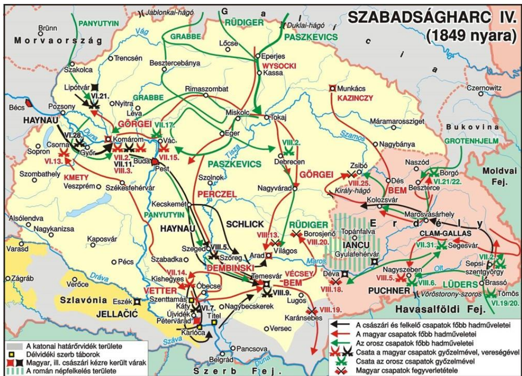
A magyar szabadságharc hadműveletei 1849 nyarán