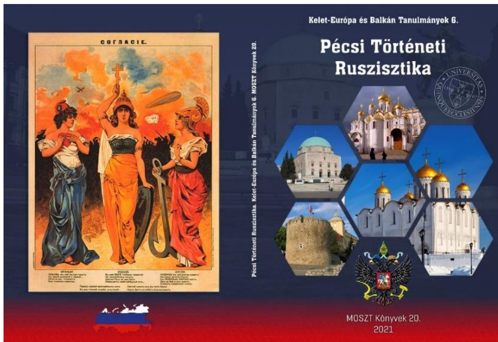
A Pécsi Történeti Ruszisztika kötet borítója