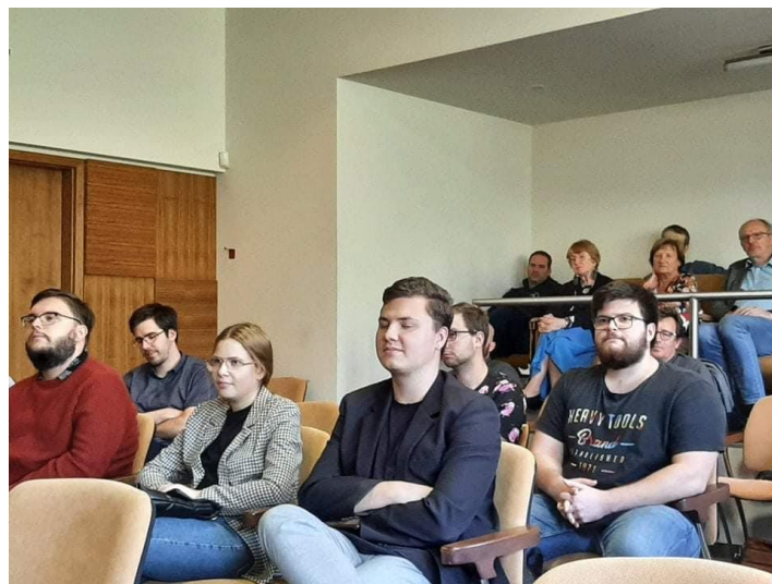
A Pécsi Történeti Ruszisztika című kötet bemutatójának közönsége