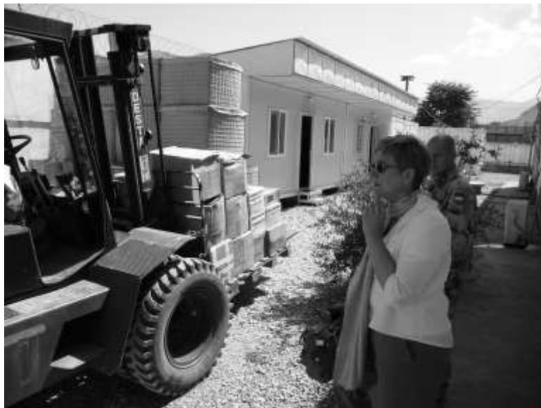
Megérkeztek a komputerek és könyvek a táborba