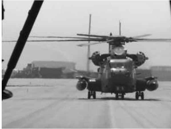
Német CH-53GS helikopter.

A Bundeswehr helyzete kicsiben jól példázza az európai NATO tagországok problémáját. Hiába van több ezer helikopter ezekben az országokban, ha azok közül sokkal kevesebb van felkészítve és modernizálva a veszélyesebb nemzetközi missziókba történő igénybevételre. Németország, tekintettel a jövőben is várható igényekre a már 92 darabra csökkent flottából 82 egységet fog felújítani 2013-ig. Ebből 40 darabot CH-53GA elnevezéssel 520 millió euróért fognak modernizálni (fedélzeti navigációs- és műszerberendezés, elektronikai, kommunikációs rendszerek, FLIR, extra üzemanyag tartályok, önvédelmi rádióelektronikai harceszközök) újabb 6000-10000 repülési órával meghosszabbítva a helikopterek teljes műszaki üzemidejét. 18