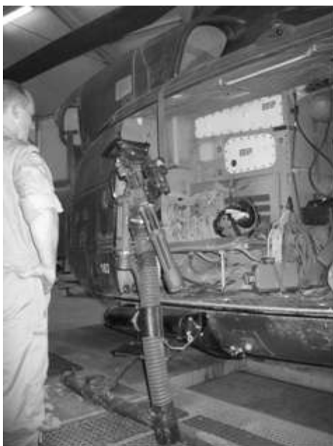
Bell 412HP, a MEDEVAC „kísérőhelikoptere” a Meymanah-i PRT hangárában.

A magyar Tartományi Újjáépítési Csoport az Északi Regionális Parancsnokság (Regional Command North) alá tartozik, amelynek irányítását Németország látja el. A résztvevő nemzetek közül ebben a régióban a Bundeswehr és Norvégia rendelkezik helikopterekkel. Jelenleg hat darab német Sikorsky CH-53GS/GE nehéz szállító helikopter áll rendelkezésre a mazar-i sarifi reptéren szállítási, MEDEVAC (egészségügyi mentés) és CSAR feladatokra. A norvég helikopterek a Meymanah-i PRT CASEVAC és MEDEVAC feladatait hivatottak ellátni.