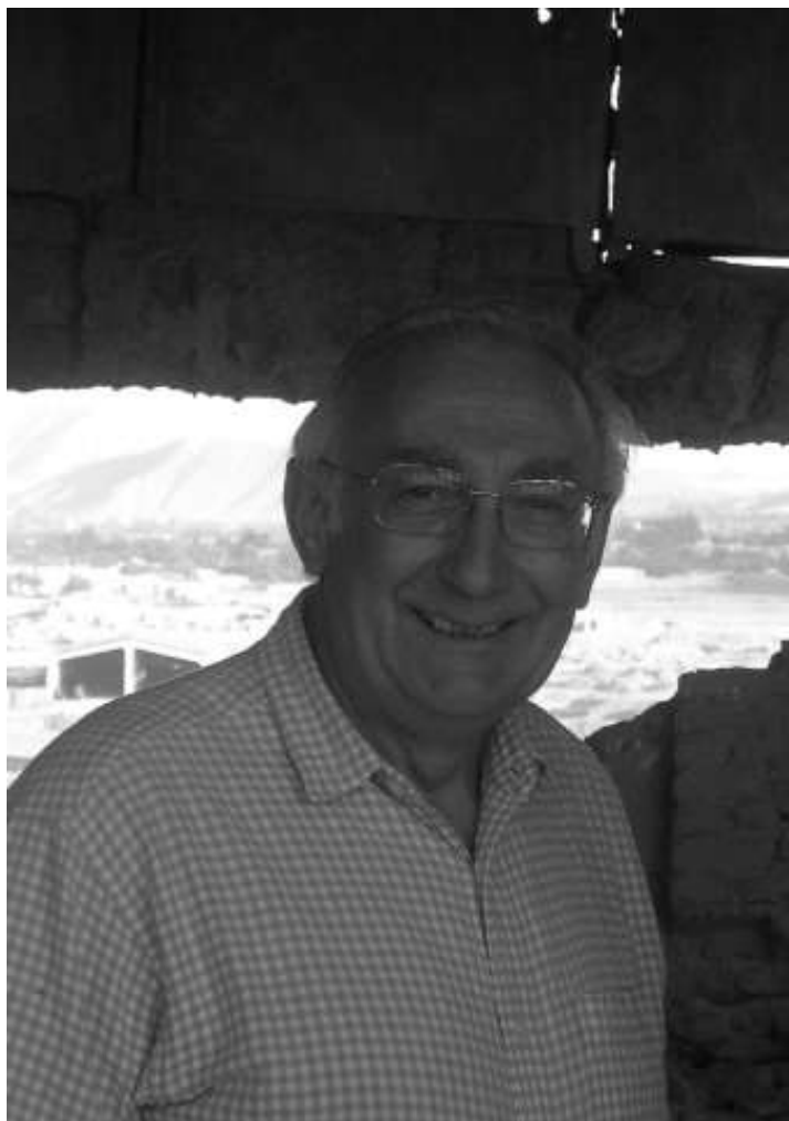
Mátys Sándor nagykövet

A delegáció látogatása a civil–katonai oktatási és tudományos együttműködés szempontjából példaértékű volt, amely mind az út megszervezése mind a lebonyolítása alatt érvényesült.