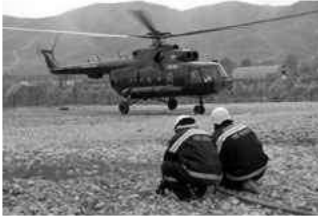
A Vertical de Aviacion Mi-17-es helikoptere.

Az eset abból a szempontból hátrányos a nemzetközi közösség számára, hogy a helyi lakosság az akciók mögött az amerikai vagy brit erőket sejteti, ami az ISAF számára egyértelműen hitelességi problémát jelent. Ezeknek a „városi legendáknak” a terjedésében az is szerepet játszhat, hogy az északon tevékenykedő amerikai különleges erők tagjai nem egyszer helyi ruházatba, hosszú szakállal, „afgán kinézetben” bukkannak fel és hajtanak végre akciókat. Ha figyelembe vesszük, hogy az említett kolumbiai Vertical de Aviacionnak régóta tartó együttműködése van az amerikai különleges erőkkel (lásd a weboldalukon történő utalást az USSOCOM -ra), akkor akár készen is van a pletykák valóságalapja: fekete helikopterekkel érkező, afgánnak látszó személyek hajtanak végre akciókat afgánok ellen.