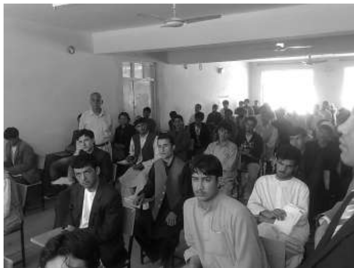
Írásbeli felvételi Pol-e-Kumriban

A delegáció kint tartózkodása alatt Baghlan tartomány érettségizett hallgatóiból – előzetes szűrések után – 64 fő tett írásbeli-, és ezek eredménye alapján 19 fő szóbeli vizsgát.