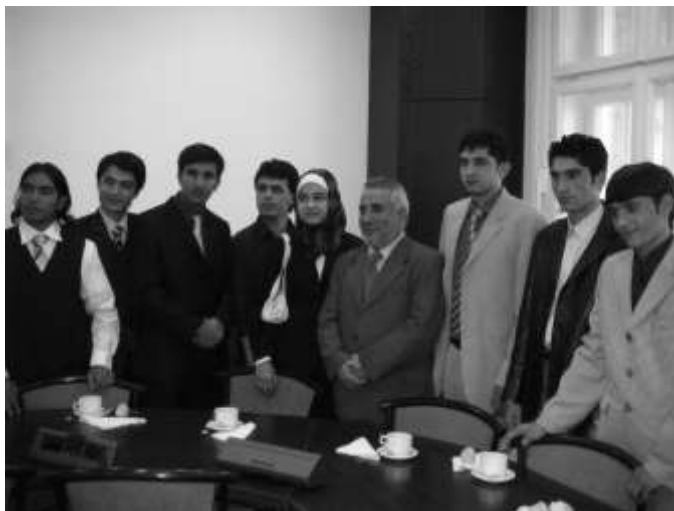
Baragzai kormányzó afgán diákok gyűrijében Budapesten

A munkatervben megfogalmazott ösztöndíj lehetőségeket az akkori oktatási tárca az afgán partnerekkel történő előzetes egyeztetés alapján fogalmazta meg, és tartalma összeesengett Kharzai elnök és Baragzai kormányzó budapesti tárgyalásaival, ahol hangsúlyozottan az oktatási ösztöndíjakról esett szó.